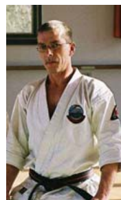
A. Modl 7. Dan